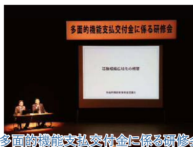
多面的機能支払交付金に係る研修会