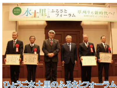
ひょうご水土里のふるさとフォーラム

本会は、「兵庫県多面的機能発揮推進協議会」の事務の一部を受託しており、活動組織・市町を対象とした研修会の開催や多面的機能支払交付金事業推進に関する業務（システムの構築、手引き等の作成、ニュース・活動事例集の作成等）を行っています。