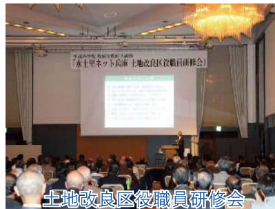
土地改良区役職員研修会

土地改良区の組織運営基盤や事業実施体制の強化を図るため、土地改良区の役職員等の資質向上のための研修等を実施。