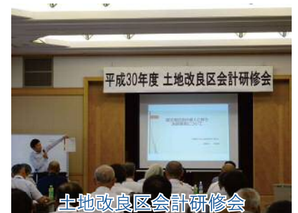
土地改良区会計研修会