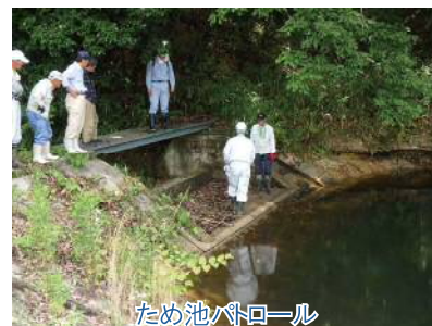
ため池パトロール

「兵庫県ため池保全協議会」が設置している「兵庫ため池保全サポートセンター」「淡路島ため池保全サポートセンター」の運営業務を受託し、ため池管理者の適正な管理活動を支え安全なため池を次世代へつなぐため、ため池パトロールの実施、ため池管理に関する技術的指導、相談等を行っています。