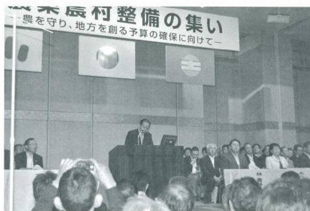
全国水土里ネット 二階会長

農業農村整備の関係者約1,000人、多数の国会議員が参集し、予算の復活を切実に訴える二階俊博全土連会長の開会挨拶を皮切りに、林芳正農林水産大臣、稲田朋美政調会長が祝辞を述べられた。続いて、3県(秋田県・新潟県・