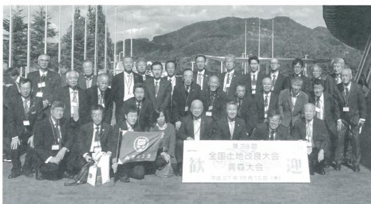
（兵庫県参加者の皆さま）

土里ネット」は、「土地改良の路繋ぎ明日への確かな途拓く」に思いを馳せ、魅力ある農業農村の明るい未来を確かなものにしていくため、農業農村の礎である「水・土・里」を健全な姿で次世代へ引き継いでいくことを、ここ、「北のまほろば青森」から宣言する』と力強い大会宣言が行われました。