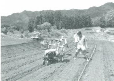
岩津ねぎの植付け

現在、夜久野高原では、近隣の道の駅の運営企業が大手企業と連携して農業生産法人を立ち上げ、岩津ねぎや枝豆などの生産を始めており、生産規模の拡大を目指しています。この動きと合わせて、さらに畑地の区画整理を進めることで、農業の振興が図られ雇用が確保されること、また、優れた景観の活用により観光客が増えることなど、地域がにぎわい、活気にあふれることが望まれます。