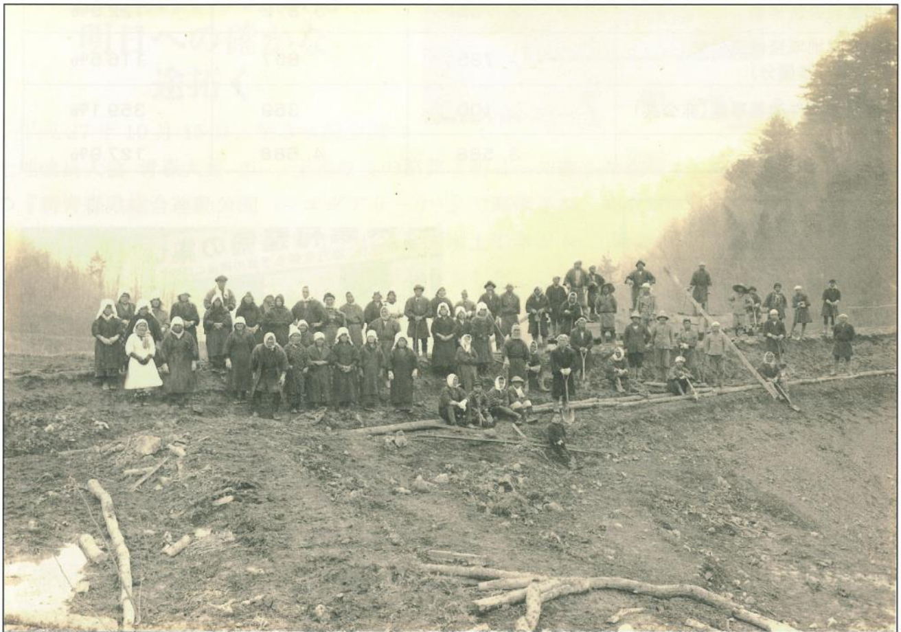
すぐたにいけ 直谷池（朝来市和田山町） 昭和初期の工事写真