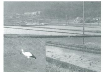
冬期湛水（コウノトリが飛来）

また、本地区は県下でもいち早く県営ほ場整備事業を実施しており、ほ場整備の先進地として地域の活性化に取り組んできました。特に久田和集落では集落営農組織を立ち上げ、農業生産法人「ファームくだわ」として、環境創造型農業による水稻やWCS（稲発酵粗飼料）、地域特産の岩津ねぎや黒大豆の栽培に取り組んでいます。「コウノトリ育む農法」による冬期湛水を行っており、コウノトリも飛来しています。